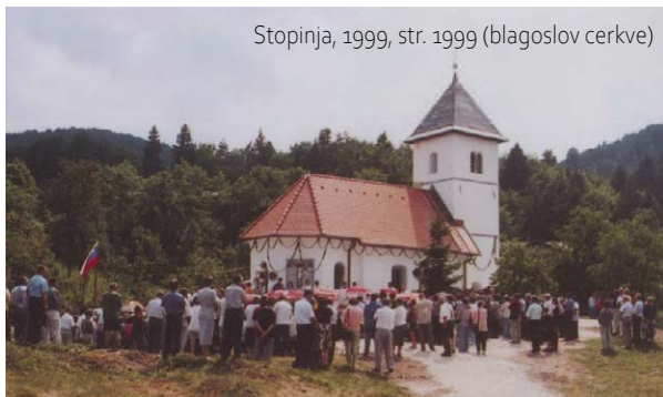
Stopinja, 1999, str. 1999 (blagoslov cerkve)

ohranila srednjeveški lesen strop. V drugi svetovni vojni je bila cerkev