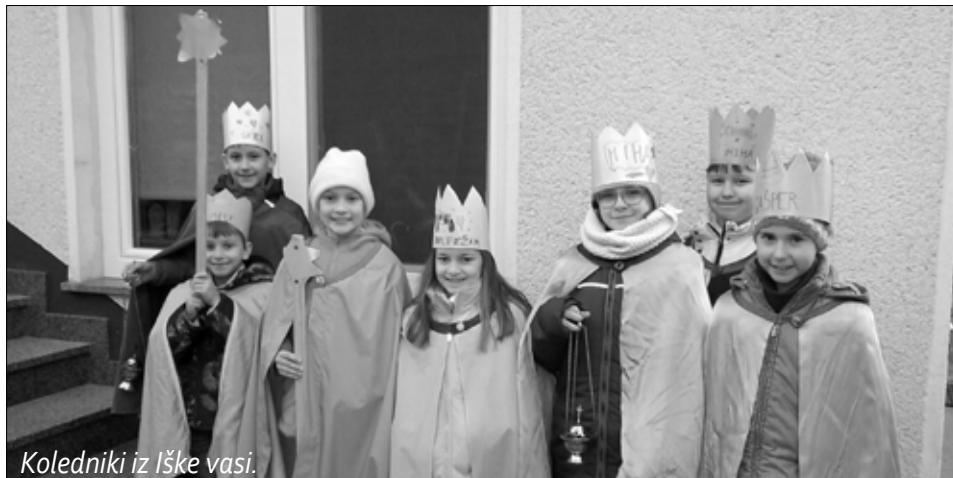
Koledniki iz Iške vasi.