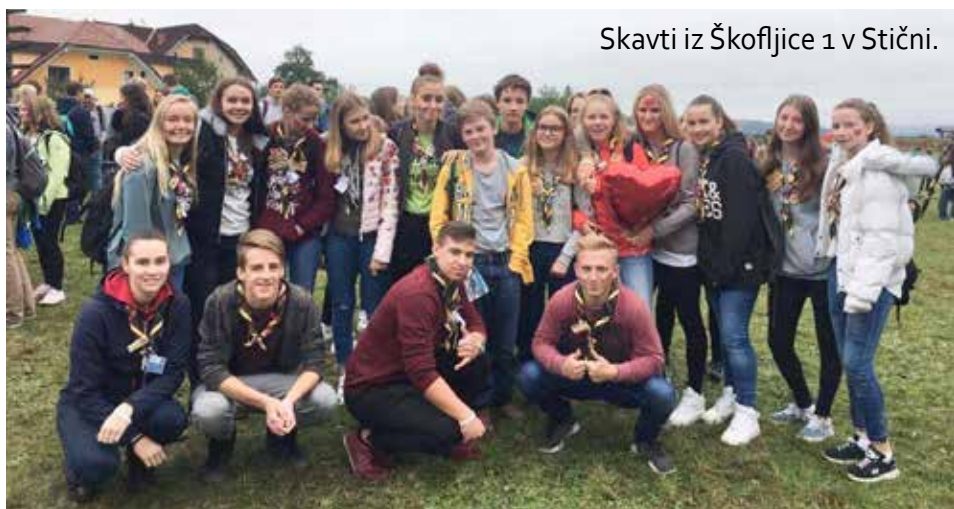
Skavti iz Škofljice 1 v Stični.

obiščemo različne delavnice. Vsako leto ima Stična mladih geslo in letošnje se je glasilo: »Velike reči mi je storil Mogočni«. Stična je bila letos posebna tudi zato, ker se je poslovil Stična bend. Lahko smo kupili njihov CD, ki so ga izdali.