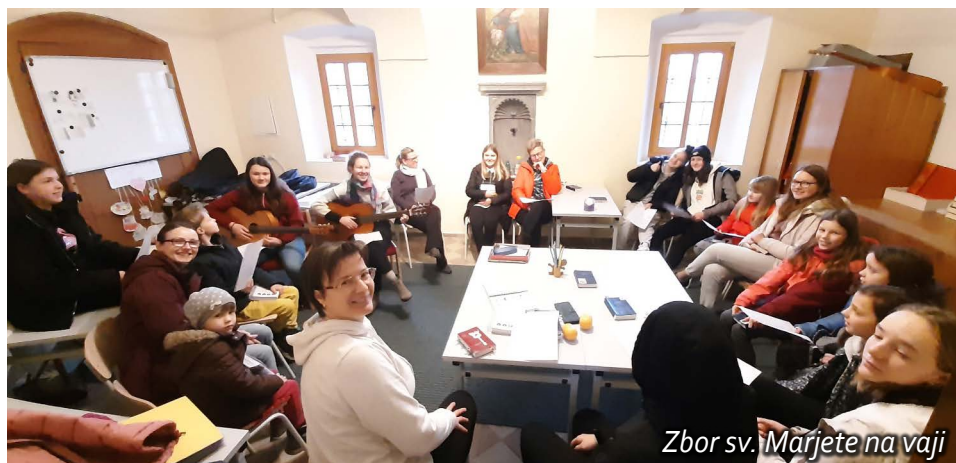
Zbor sv. Marjete na vaji